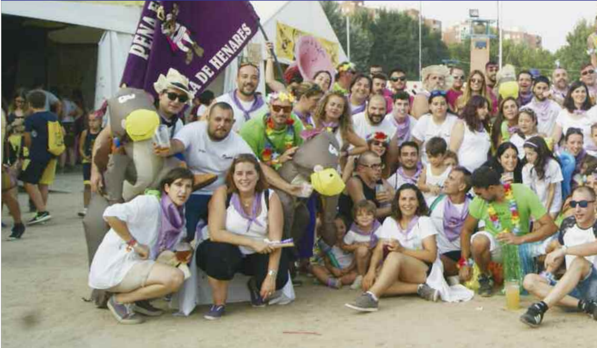
Decenas de peñistas bailaron al son del ritmo impuesto por la charanga que empezó en la caseta de El Juglar para ir pasando por cada una de las casetas de las peñas para contagiar el buen ambiente y finalizar dos horas después en la carpa de El Golpe