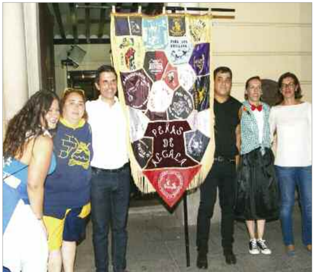
Tras dos horas de cabalgata, los representantes de las peñas retiraron el estandarte del balcón del ayuntamiento y las peñas cantaron el “pobre de mí, que se han acabado las fiestas de Alcalá”